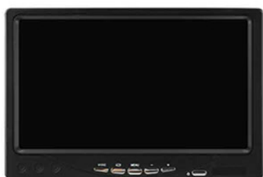
7 palcový monitor